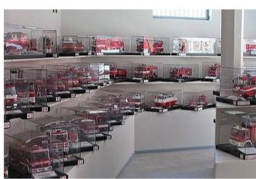
Das Feuerwehrmuseum «Galleria storica vigili del fuoco» stellt rund 90 handgefertigte Feuerwehrmodelle aus