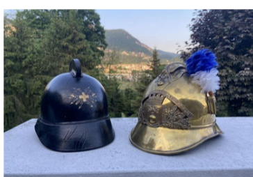
Das Museo Pompieri Lugano TI zeigt einen Teil seiner Sammlung an Helmen und Uniformen